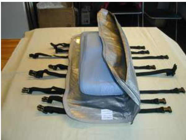
Bild 3: Fahrzeug aufschieben, Auto-Sturm-Hülle und PermaBag über das Fahrzeug legen