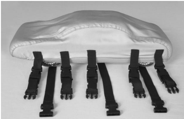
Bild 4: Die 5 kurzen Gurte unter das Fahrzeug führen und an den gegenüber seitlich liegenden Clips einrasten.

Bild 3: Die 5 kurzen Gurte auf die Clips stecken, die an der Abdeckung seitlich angebracht sind.