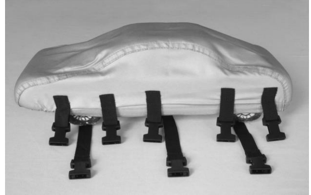
Bild 3: Die 5 kurzen Gurte auf die Clips stecken, die an der Abdeckung seitlich angebracht sind.

Bild 2: Das Fahrzeug anschließend mit den mitgelieferten Abdeckungen zudecken.